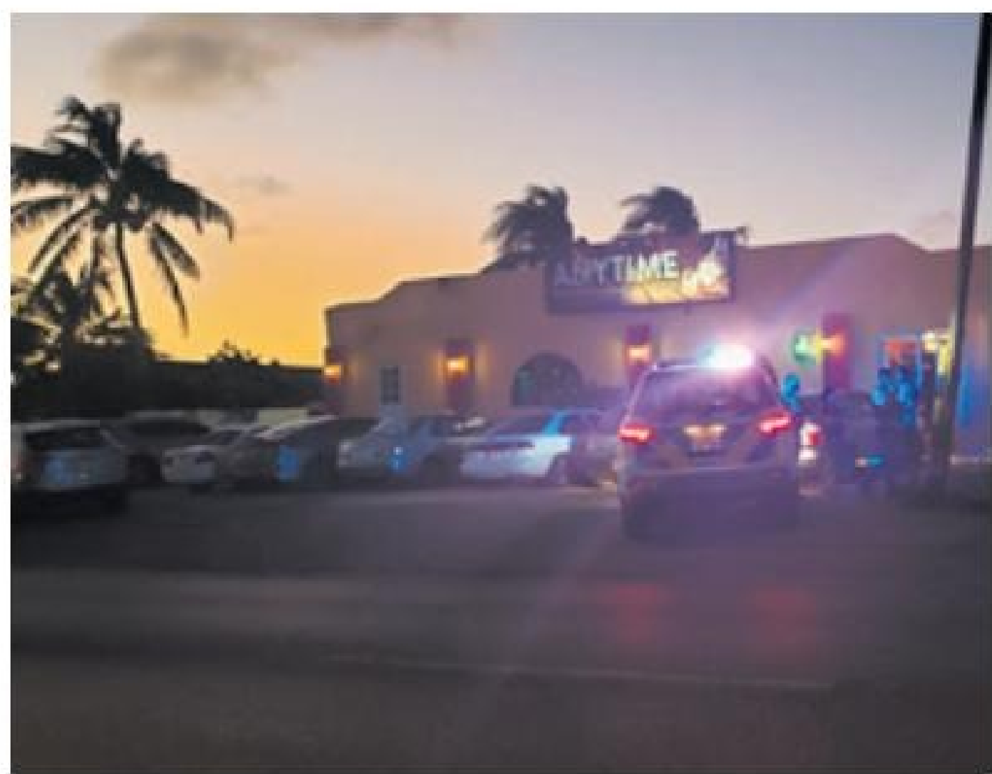
Paradera - Diasabra atardi pa mas o menos 6:30 polis a bay un bar restaurant